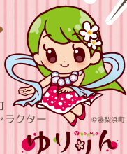
湯梨浜町 天女キャラクター ゆりぽん